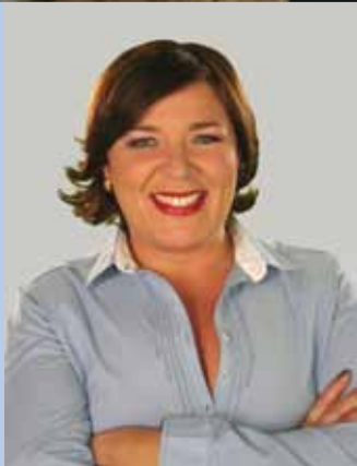
VERA INT-VEEN, TV-MODERATORIN

Deutsche Telekom, DEVK, Generali, Münchner Rück – nur vier von vielen deutschen Unternehmen, die Aktion Deutschland Hilft bereits bei zahlreichen Einsatzfällen mit Großspenden unterstützt haben. Langjähriges Engagement zeigt auch das Hamburger Miniatur-Wunderland , das mit immer neuen kreativen Sammelaktionen auf die Situation von Menschen in Not aufmerksam macht und zu Spenden für das Bündnis aufruft. Und BonnSoir , das Mittelstandsnetzwerk der Region Bonn-Rhein-Sieg, richtet seit vielen Jahren gemeinsam mit Aktion Deutschland Hilft Veranstaltungen aus, bei denen wichtige neue Kontakte zur regionalen Wirtschaft geknüpft werden können.